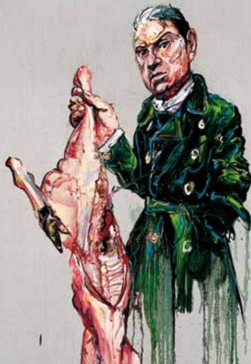
Zeng Fanzhi. Bacon and Meat (fragmento). Óleo sobre tela. 2008.