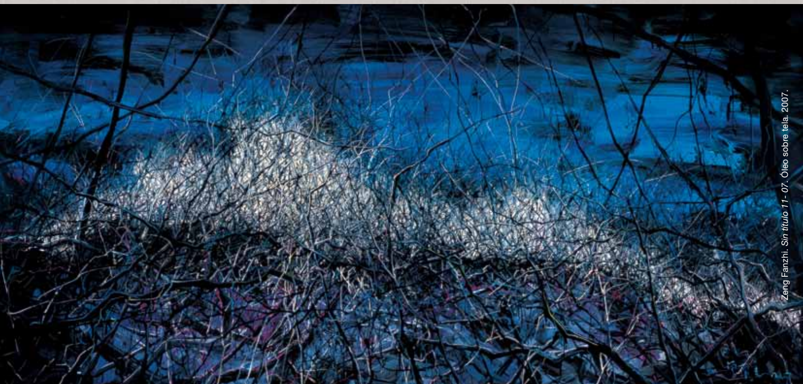
Zeng Fanzhi. Sin título 11-07. Óleo sobre tela. 2007.

For the first time in Spain, the Fundación Francisco Godia is presenting the work of Zeng Fanzhi, one of the most personal creators in the current generation of Chinese artists who has made the leap into the most prestigious galleries, major international exhibitions and museums. Zeng Fanzhi's art combines elements of the Western and Eastern traditions: traditional Chinese painting, socialist realism and abstract expressionism. This exhibition displays works from his own personal collection: the items he loves the most and has never wanted to sell. Through this initiative the Fundación Francisco Godia is opening up a new form of collaboration with active artists and putting the latest trends in contemporary art on show.